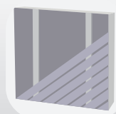
Pose diagonale simple lambourrage