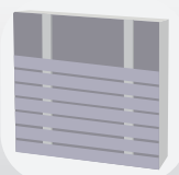
Pose horizontale simple lambourrage