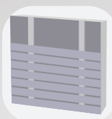
Pose horizontale simple lambourde