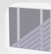
Pose diagonale simple lambourde